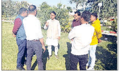
भिवानी। पार्क का निरीक्षण करते नप चेयरमैन

शहर के तीन पार्कों पर खर्च होंगे 1.86 करोड़ शहर में पार्क के नाम पर केवल रोज गार्डन ही है