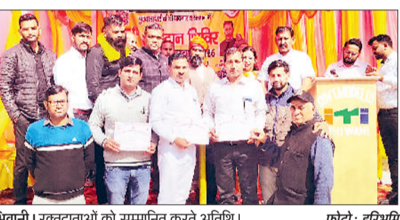
भिवानी। रक्तदाताओं को सम्मानित करते अतिथि।

जरूरतमंदों की जान बचाकर सीधे तौर पर मानवता की रक्षा करता रक्तदान: डुडेजा