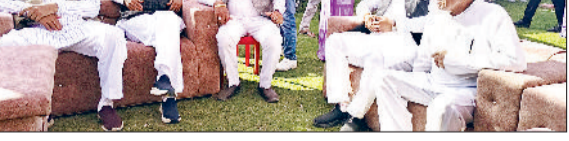
हरिभूमि न्यूज ►► भिवानी