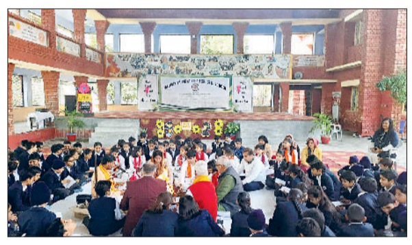
भिवानी। आयोजित कार्यक्रम में उपस्थित शिक्षक व बच्चे।

हलवासिया विद्या विहार के प्राथमिक विभाग में कक्षा पांचवी के विद्यार्थियों के लिए उत्कर्ष समारोह का आयोजन