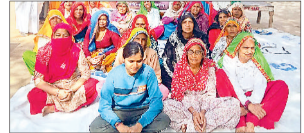
भिवानी। जागरूकता शिविर में शामिल बीके बहने व ग्रामीण महिलाएं।

महिला बच्चों से लेकर बुजुर्गों तक की आधारशिला है, आध्यात्मिक मूल्यों को जीवन में धारण कर घर परिवार व समाज को श्रेष्ठ बना सकती है। यह उद्गार प्रजापति ब्रह्माकुमारी ईश्वरीय विश्वविद्यालय की झोझुकलां शाखा द्वारा महाशिवरात्रि पर्व व राष्ट्रीय महिला दिवस के उपलक्ष्य में बधवा गांव के हनुमान मंदिर में महिला एवं परिवार विषय पर महिलाओं को