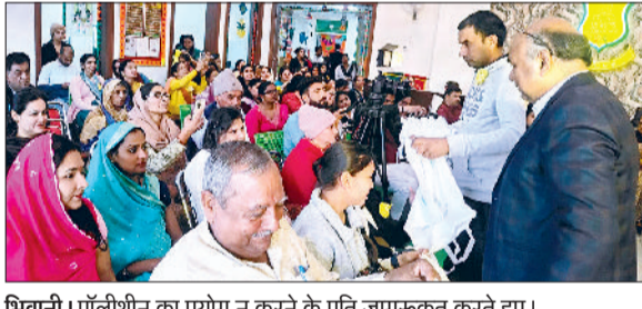
भिवानी। पॉलीथिन का प्रयोग न करने के प्रति जागरूक करते हुए।

सिंगल यूज प्लास्टिक का इस्तेमाल नहीं करने को लेकर लिटल हर्ट इंटरनेशनल स्कूल में कार्यक्रम का आयोजन